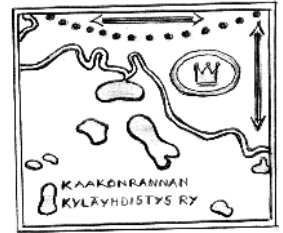
2. Matti Kinnusen ehdotus. (Myös väri-versio.)