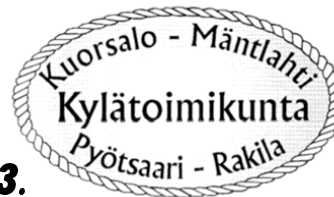
3. Martti Tammisen ehdotus. (Useita versioita.)