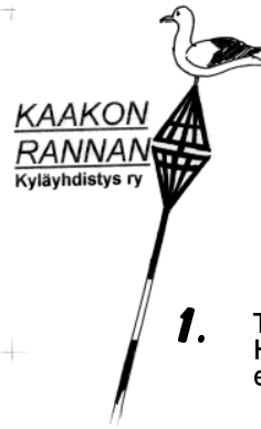
1. Tesma Hellströmin ehdotus.

Omatekoiset äänestyslipukkeet voi laittaa Eeva Salaston postilaatikkoon Ojalanpolku 7 Mäntlahti. Äänestää voit myös netissä kotisivuillamme. Äänestysaikaa on joului- ja tammikuu.