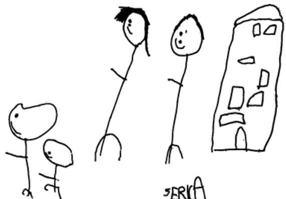
Nelivuotias Serica piirsi meille perheensä.