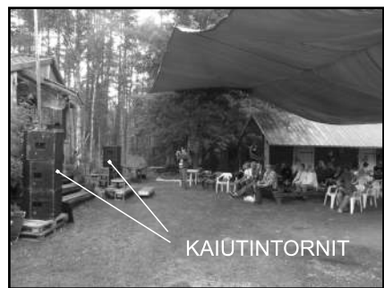
Yllä: Kaiutintornit ja pressu. Alla: alue jonne ääni on suunnattu. Oikealla: edessä miksaus-pöytä ja näkömä äänen keskeisestä suuntaus-kohteesta.